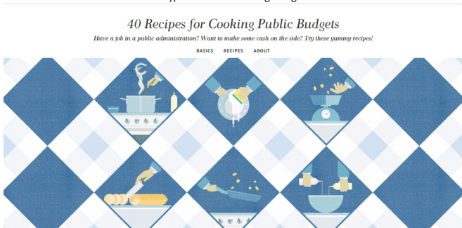
Στιγμιότυπο του Cooking Budgets

Το Cooking Budgets είναι μια συλλογή των χειρότερων πρακτικών των δημόσιων υπαλλήλων με σκοπό να πλουτίσουν ή να κακοδιαχειριστούν τα δημόσια ταμεία. Κάθε πράξη είναι αποκομμένη από πραγματικά παραδείγματα και είναι μια «συνταγή» που είναι εύκολο να διαβαστεί και να κατανοηθεί.